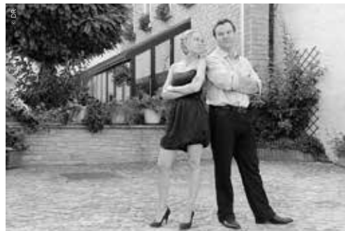
Duo Vent d'Anches